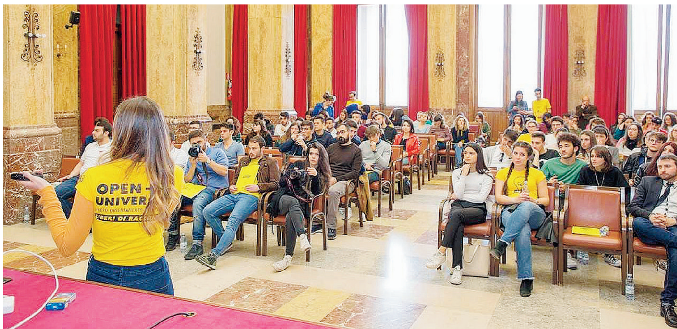
Un passaggio di testimone di "conoscenze". I ragazzi dell'Università raccontano ai loro "successori" le loro esperienze all'Ateneo

Tutto ciò rappresenta un ulteriore passo nell'alveo del percorso avviato di valorizzazione e sfruttamento turistico-culturale del Teatro Vittorio Emanuele, un'occasione di sviluppo economico per gli stakeholder del settore e per la riappropriazione del pubblico di spazi, bellezza e storia messinese. ◀